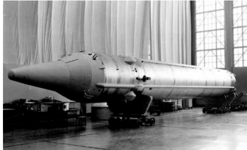
МБР УР-100 {1967}