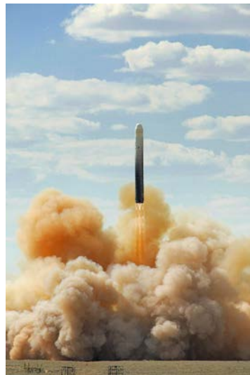
МБР УР-100Н УТТХ {1980}